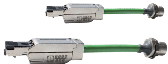
Adapterset RJ45 Stecker auf M12 Buchse für PROFINET